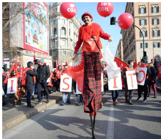
Alcune immagini della manifestazione «Futuro al Lavoro». Un lungo corteo condito da canti e bandiere, tanto che piazza San Giovanni è riuscita a contenere a stento l'ondata del serpente dai colori rosso, verde e azzurro