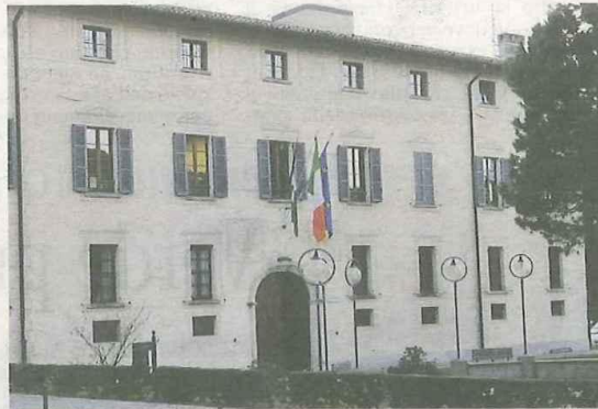
MUNICIPIO Il sindacato chiede garanzie a chi sarà il nuovo sindaco