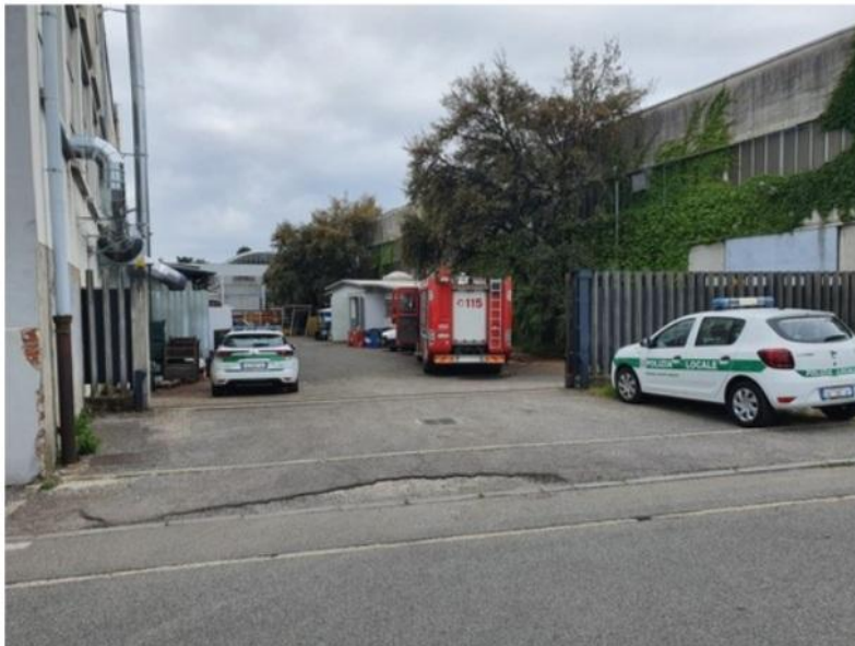
L'intervento dei soccorsi, vano, nella ditta in cui si è verificato l'incidente mortale

Appuntamento il 6 maggio, alle 9, davanti alla Bandera. Unanimi i sindacati: infortuni mortali in aumento, occorre investire sulla sicurezza. Due ore di sciopero venerdì nelle aziende