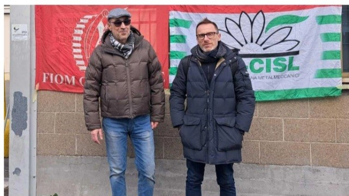
PetrolValves, alta tensione. Sindacati e proprietà lontani. Il braccio di ferro continua