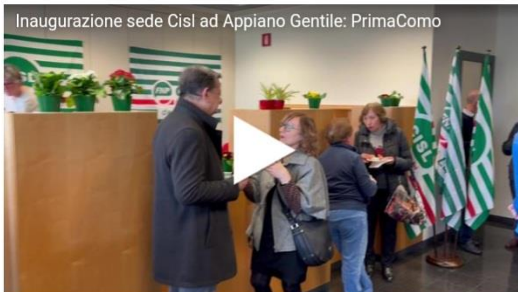
Inaugurazione sede Cisl ad Appiano Gentile: PrimaComo